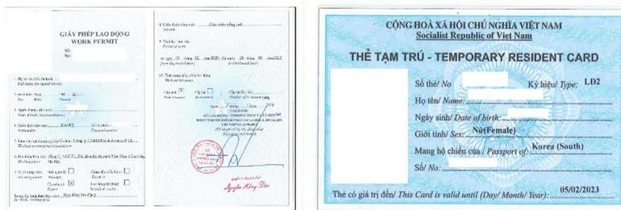
Hình ảnh Giấy phép lao động và Thẻ tạm trú của Point Avenue do TRUELAW thực hiện